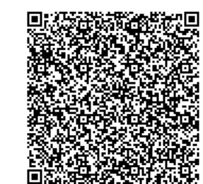
ศูนย์พัฒนวิชาการพระนคร มทร.พระนคร

ศูนย์พัฒนวิชาการพระนคร 88 ถ.พิษณุโลก แขวงสวนจิตรลดา เขตดุสิต กรุงเทพมหานคร 10300 (คณะบริหารธุรกิจ และคณะศิลปศาสตร์) 517 ถ.นครสวรรค์ แขวงสวนจิตรลดา เขตดุสิต กรุงเทพมหานคร 10300 (คณะอุตสาหกรรมสิ่งทอและออกแบบแฟชั่น) การเดินทาง รถประจำทางสาย : 5, 10, 16, 23, 99, 157, 201 รถปรับอากาศประจำทางสาย : ปอ.16, ปอ.23, ปอ.505, ปอ.509, ปอ.171