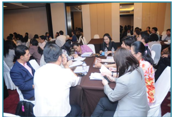
ผู้เข้าประชุมสัมมนาฟังบรรยาย และทำกิจกรรมร่วมกัน