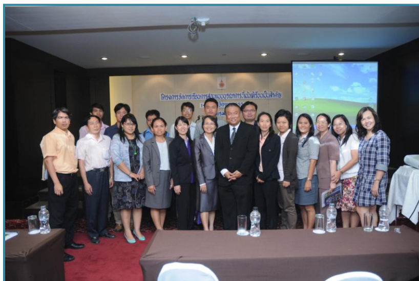
ผู้แทนจากคณะร่วมถ่ายภาพกับวิทยากรเป็นที่ระลึกในความสำเร็จของโครงการในวันแรก