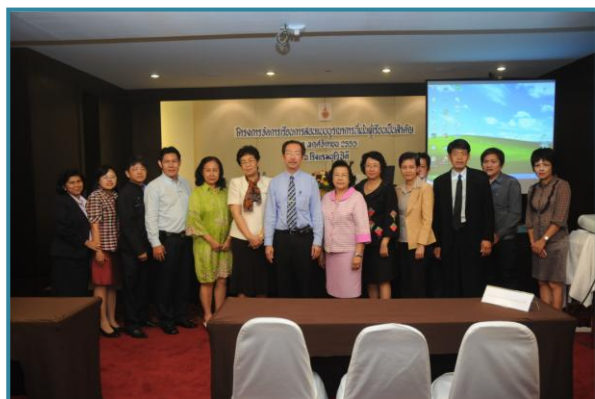
ผู้อำนวยการสำนักส่งเสริมวิชาการและงานทะเบียน กล่าวปิดการโครงการ มอบของที่ระลึกให้กับวิทยากร และถ่ายภาพเป็นที่ระลึกในความสำเร็จของโครงการฯ