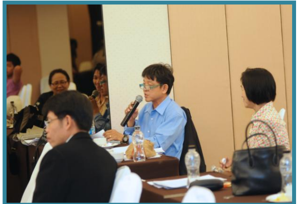
ผู้เข้าอบรมรับฟังการบรรยายและมีข้อซักถามระหว่างวิทยากร