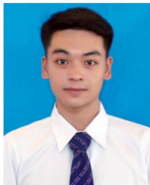
แบบชุดนักศึกษาชาย

หากนักศึกษาไม่สะดวกเข้าถ่ายรูปนักศึกษา ให้นักศึกษาดำเนินการ แนบไฟล์รูปนักศึกษา ส่งมาที่อีเมล REGISTER@RMUTP.AC.TH พร้อมแจ้งรหัสนักศึกษา , ชื่อ - นามสกุล ภายในวันที่ 17 ก.ค. 2563 เวลา 16.00