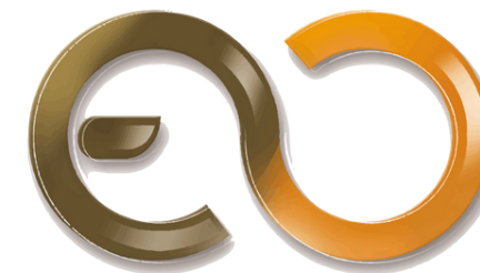
คณะสถาปัตยกรรมศาสตร์และการออกแบบ