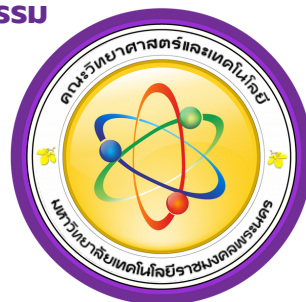
คณะวิทยาศาสตร์และเทคโนโลยี